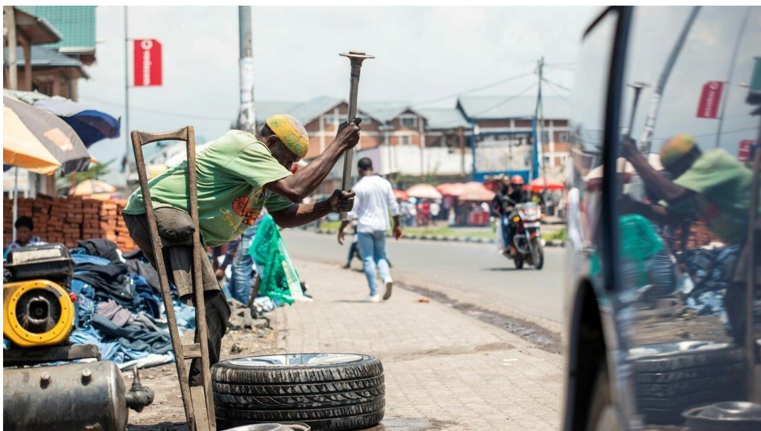
Image du photographe congolais Moses Sawasawa qui organise avec Arlette Bashizi au Stade paralympique de Goma (RDC), du 3 au 24 décembre, l'exposition « Sans limite » sur la situation de personnes handicapées.