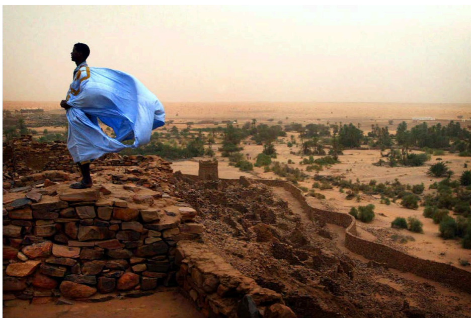
L'ancienne ville de Ouadane, en Mauritanie, en août 2005.